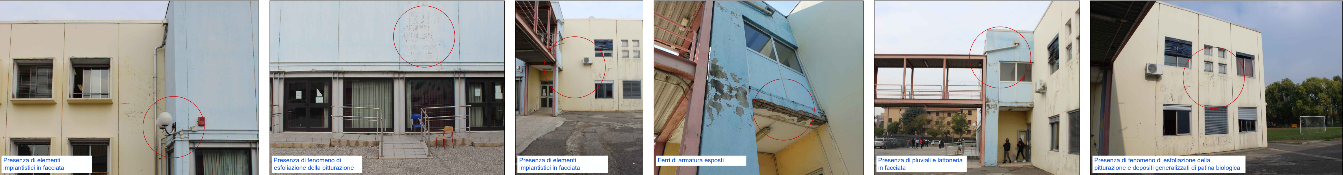
Viste esterne - Prospetto Sud