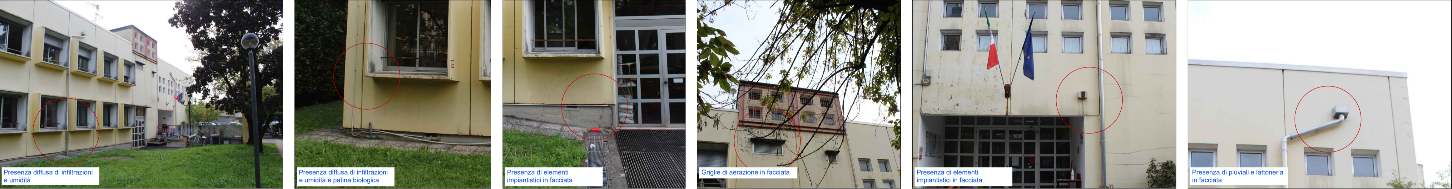
Viste esterne - Prospetto Ovest